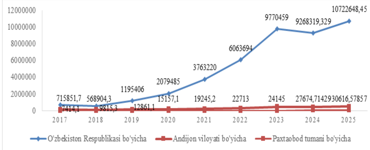
To'qimachilik sanoatiga investitsiyalarning to'g'ridan-to'g'ri jalb etilish dinamikasi [4]

Paxtaobod tumani misolida to'qimachilik sohasida ham bir qator tizimli muammolar kuzatilmoqda. Xususan, ayrim zamonaviy tikuvchilik va bo'yash korxonalarining ishlab chiqarish quvvati to'liq ishga solinmagan, rentabellik darajasi past bo'lib qolmoqda hamda ilg'or texnologiyalardan foydalanish darajasi yetarli emasligi sezilmoqda. Shuningdek, Paxtaobod tumanida ishlab chiqarilgan mahsulotlarni tashqi va ichki bozorlarga yetkazib berishda logistika tizimlarining to'liq rivojlanmagani, to'qimachilik mahsulotlarini sertifikatlashtirish jarayonidagi ayrim muammolar yirik eksport bozorlariga chiqish imkoniyatlarini cheklab qo'yimoqda. Yana bir muhim jihat shuki, tarmoqda malakali boshqaruv kadrlari yetishmovchiligi mavjud bo'lib, ayrim rahbar xodimlarning boshqaruv kompetensiyalari past darajada ekanligi, xodimlarni rag'batlantirish va motivatsiya tizimining sustligi korxonalarining samarali faoliyatiga to'sqinlik qilmoqda.